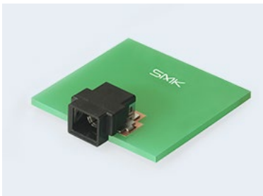
Receptacle : CRS5001-3202F