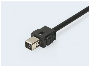
プラグ : CRC9001-4402F