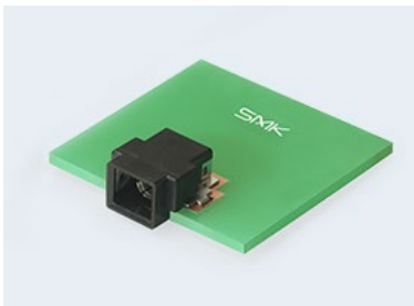
レセプタクル : CR5001-3202F

公称インピーダンス75Ωタイプも揃えています。 仕様他違いますので、お問い合わせください。